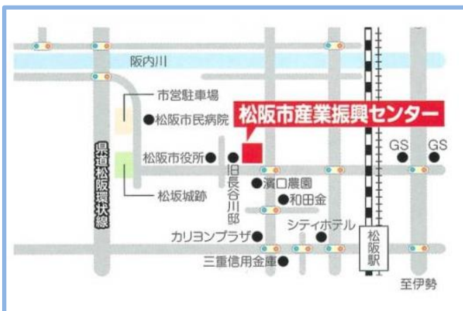
③ 松阪市産業振興センター