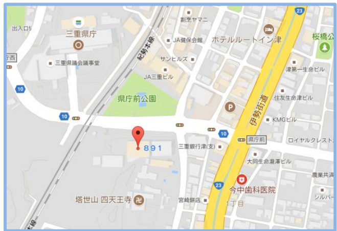
② 三重県産業支援センター