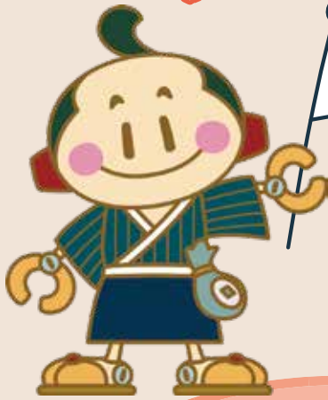
松阪商人サポート隊キャラクター 豪商あつきくん

松阪市内で新しく創業を考えている方、事業の継続や更なる成長を考えている方など、新たな事業展開を目指す方のためのきっかけとなるセミナーです。