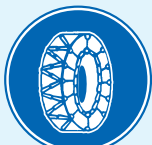
「チェーン規制」の区間であることを表す標識